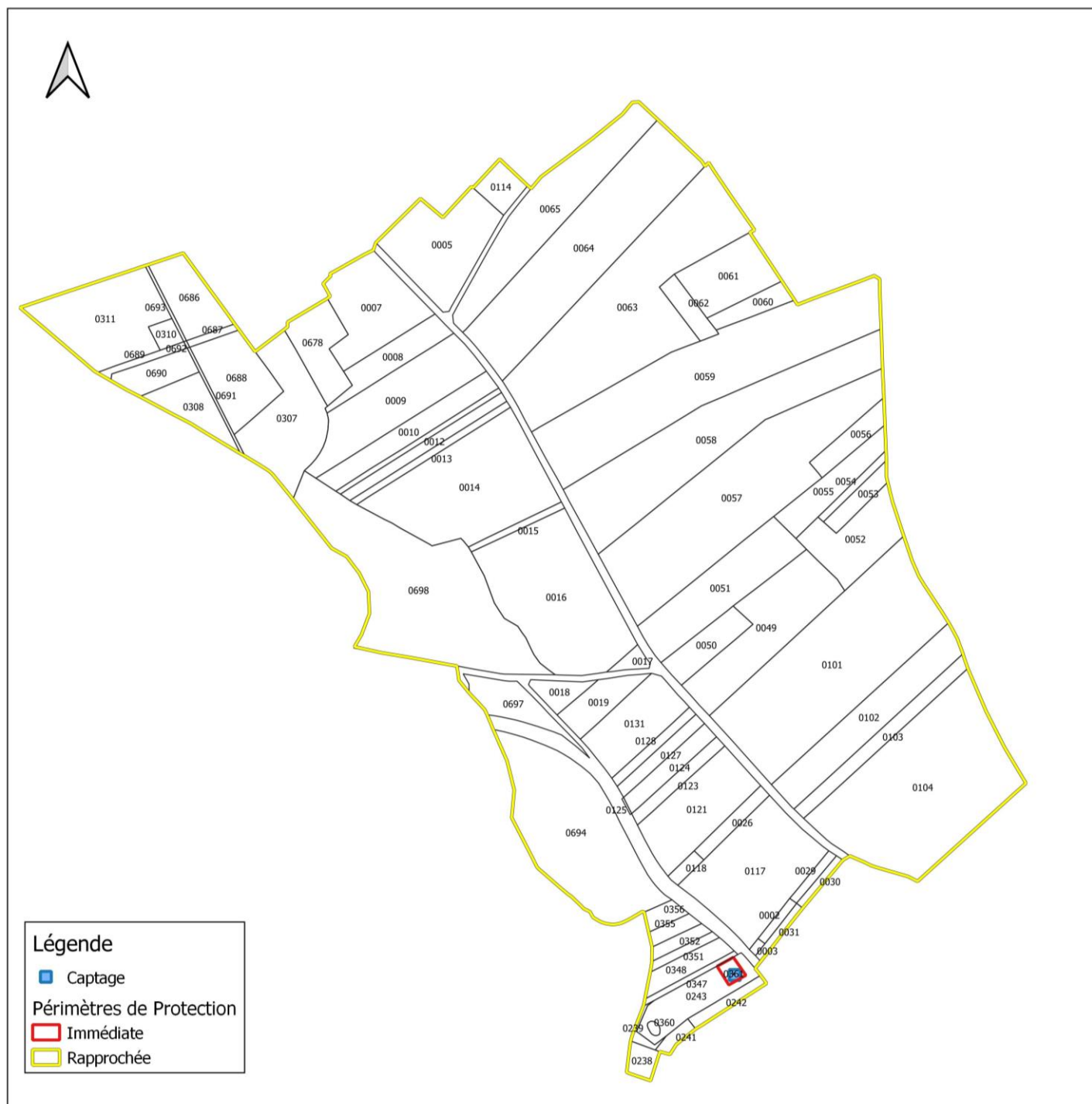
Figure 3 : parcellaire PPR.