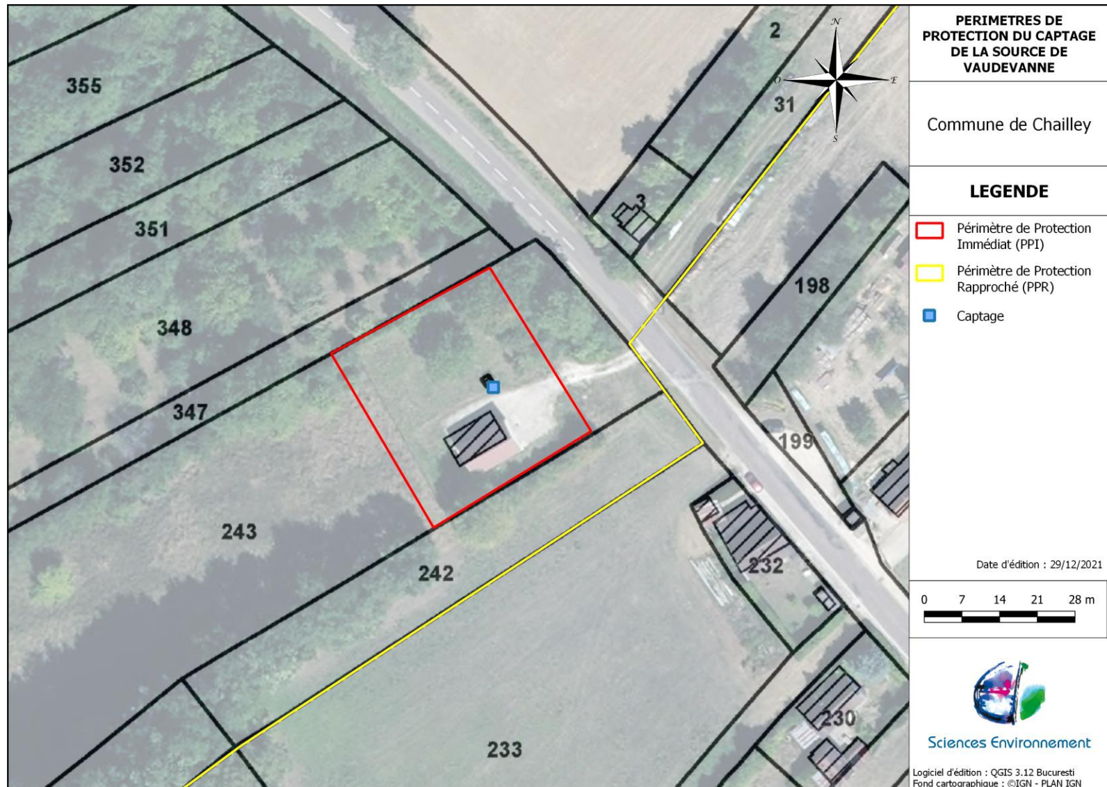
Figure 1 : Délimitation du PPI (Périmètre de Protection Immédiate) du captage de la source de Vaudevanne